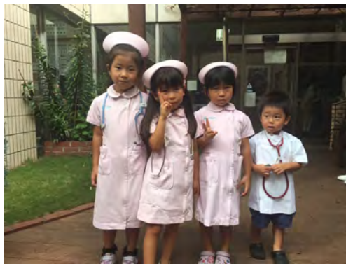
ナースに変身してみよう！！