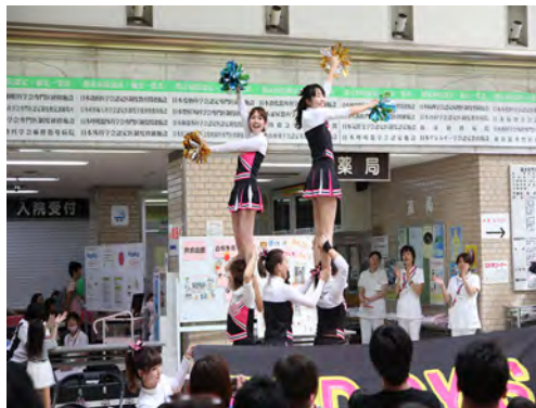
Buddy's によるチアリーディング