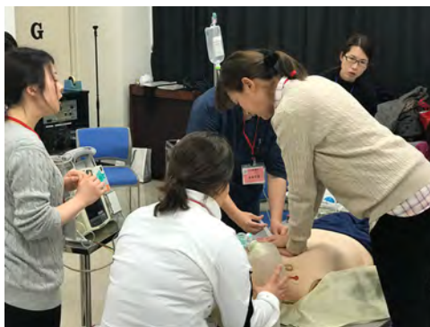
医師、看護師による救急救命トレーニング

ICLS 講習会（救急救命トレーニング）を11月26日に開催し、研修医3人、看護師11人、臨床検査技師2人、臨床工学技士1人、作業療法士1人、消防2人の計20人が受講しました。このトレーニングは「突然の心停止に対する最初の10分間の対応と適切なチーム蘇生」を習得することを目的としています。午前中は気道管理などの一次救命措置のおさらいを行い、午後は4グループに分かれ不整脈や心停止の患者を想定したトレーニングを、最後に様々な状況を設定したロールプレイングを行いました。当院ではこのような講習会や勉強会を定期的に行っています。また他の講習会も掲載いたしますので皆様には是非知っていただけたらと思います。