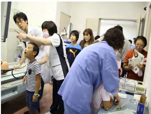
内視鏡検査を体験