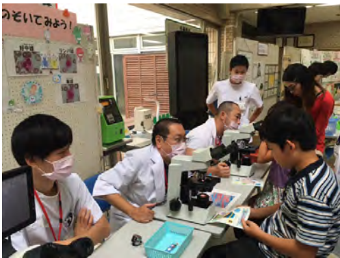
血液成分の標本をのぞいてみよう！！