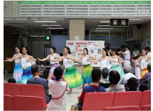
チーム「ノヘア」とチーム「クプナ」によるフラダンス

富士宮市立病院の一般開放イベントである「ふれあいフェスティバル～楽しく知ろう！病院のあれこれ！～」を平成28年9月25日(日)に行いました。イベント当日は約300人の市民の方が来院し、救急車・DMAT車の見学、調剤体験、手術室・内視鏡室見学ツアーなど様々な医療体験をしました。また、地域医療を守る会の方々もブースを設置し活動の紹介などを行いました。エントランスホールの特設ステージでは、ダンスBOXジャグリングクラブによるジャグリングや、Buddy'sによるチアリーディング、チーム「ノヘア」とチーム「クプナ」によるフラダンス等、様々な催しが企画され大勢の観客でにぎわいました。会場には、親子連れも多く訪れ「普段、病院を訪れる機会はないので、手術室や内視鏡室など普段入れない場所のツアーは貴重な経験になった。来年も来たい。」との声が聞かれました。