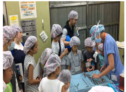
手術室体験ツアーの様子