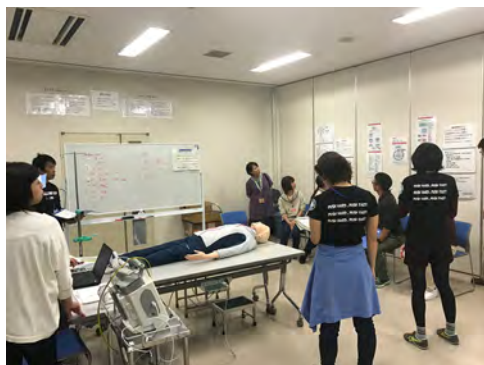
講師の職員による講義の様子