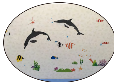
イルカをはじめかわいい海の生き物がたくさんいます。

小児科外来を模様替えしました。壁紙を一新して明るくポップな雰囲気になっています。フロアには色々な動物の足跡が散りばめられており、とてもユニークな仕様になりました。