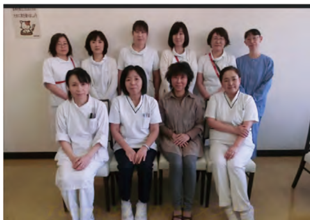
Team STEPPS WG のメンバー

看護部有志10名による「Team STEPPS WG」が中心となり、「あなたにとって患者安全とは？」をテーマに医療に従事する職員達が安全に医療を提供するために日々大切にしている「3つの言葉」をキーワードとして動画を作成しました。ホームページから見るができます。下のURLと右側のQRコードから動画がご覧になれます。また当院1階エントランスホールのデジタルサイネージ（電子掲示版）でも動画を流していますので是非ご覧ください。