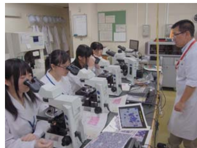
血液や臓器を顕微鏡で観察