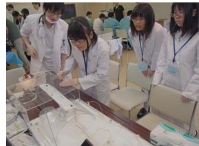
カテーテルを扱う