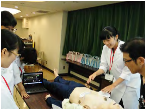
救急救命措置方法を体験 (医師コース)