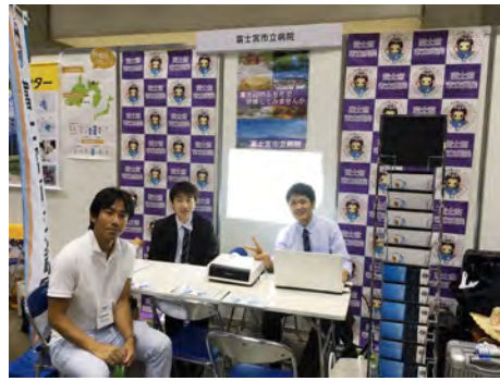
当院のブース前にて