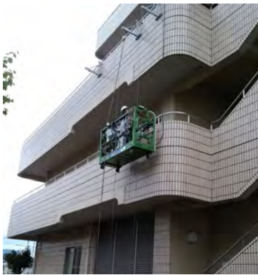
外壁打診検査の様子(平成28年度実施)

病院建物の外壁について、昨年度実施した建築基準法に基づく打診検査の結果、一部の外壁タイルに浮き・ひび割れ等が確認されました。それに伴い、平成29・30年度の2ヶ年に渡り外壁改修工事を実施いたします。今年度の工期は平成29年9月1日～平成30年1月31日です。既存タイルを剥がし、新しいタイルを取り付けるため、工事期間中は騒音が発生します。ご迷惑をおかけしますが、ご理解とご協力をお願いいたします。