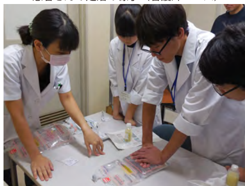
薬剤の準備 (薬剤師コース)