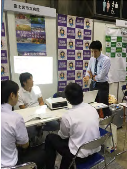
当院の説明にも熱が入ります