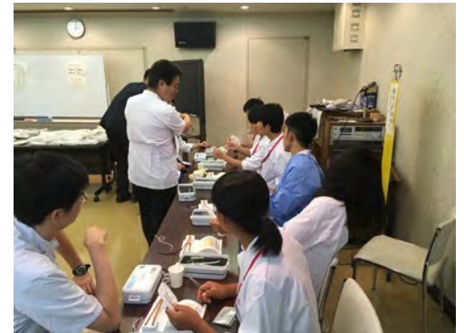
縫合方法を体験 (医師コース)