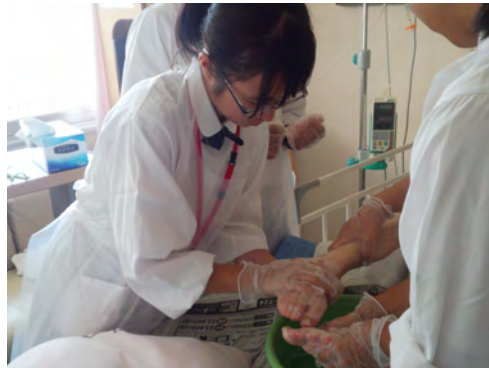
患者さんの足浴の様子 (看護師コース)