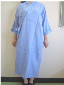
ガウンタイプの病衣