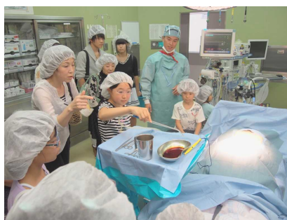
手術室見学ツアー