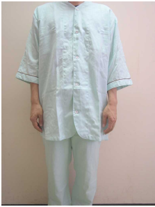
パジャマタイプの病衣