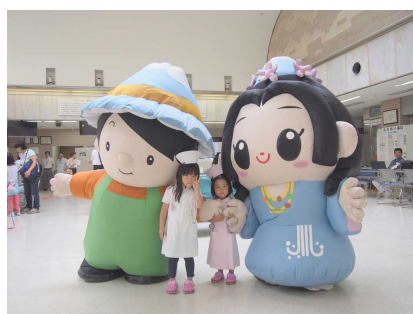
ふーちゃんとさくやちゃん