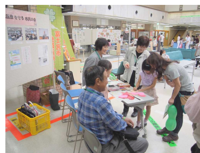
地域医療を守る会のブース