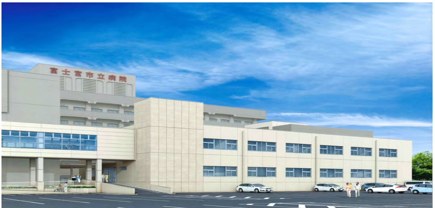
地域包括ケア病棟の完成イメージ

しかしながら今後の超高齢化社会の予測と、当院整形外科の診療体制の回復見込みから鑑み、“地域包括ケア病棟”を以前のような“整形外科専用病棟”に戻し、新たに“地域包括ケア病棟”を増築して両立させていくことが、富士宮市の掲げている「地域医療の充実により市民が健康に暮らせるまちづくり」に貢献できるものと考え、今回“地域包括ケア病棟”を建設することといたしました。