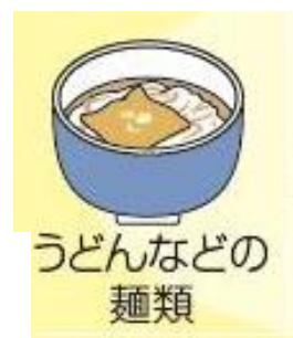
うどんなどの 麺類